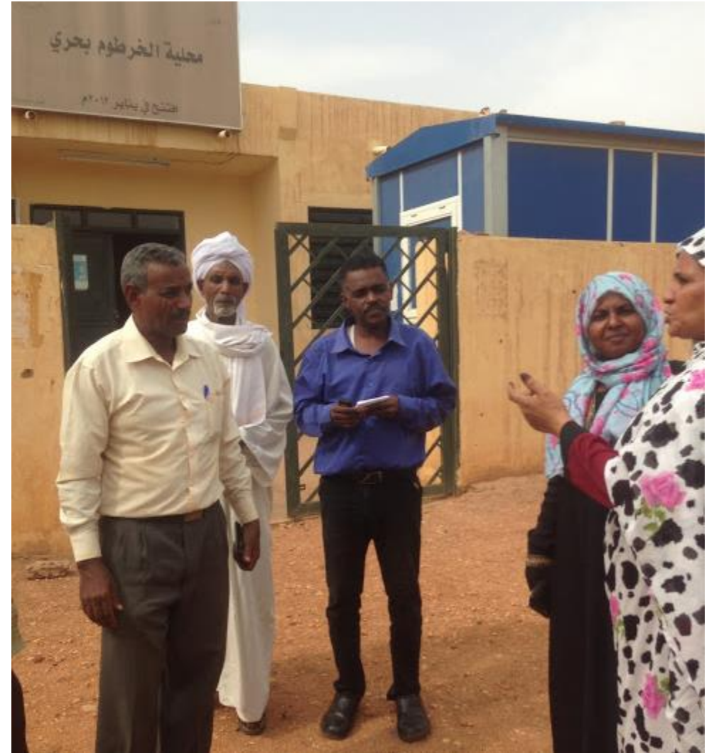
Explanation to the residents Explication aux résidents