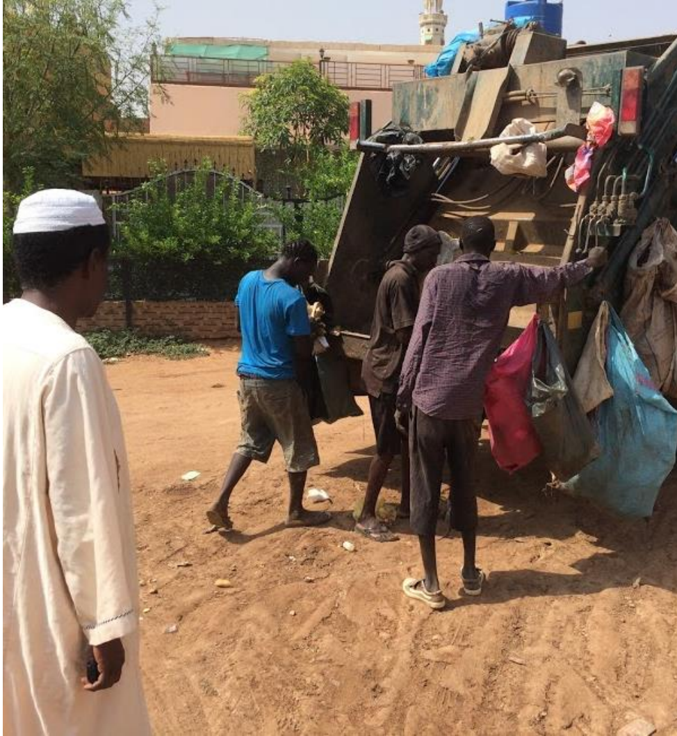
Waste collection Collecte des déchets